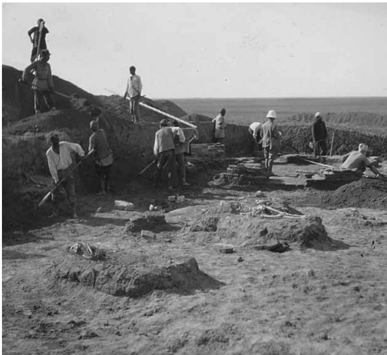
FIG. 2. Grävarbete vid Shah Tepé 1933. Ture Arne i tropikhjälm till höger, omgivnen av persiska arbetare.

fram och föras ”hem” till museet i Stockholm för att bygga upp dess samling. Poängen med att ha dem där var att de skulle bilda en ”komparativ”, jämförande samling av de Andras föremål som kunde sättas i relation till Våra föremål. Principen var att svenskarnas tänkta evolution och materiella utveckling skulle tydliggöras genom jämförelser med andras.